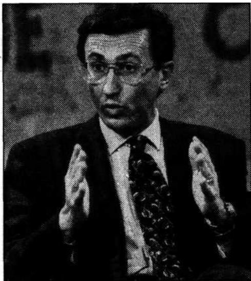
Gianfranco Fini, Führer der Alleanza Nazionale

Es deutet einiges darauf hin, daß Fini sein ambivalentes Taktieren nach dem Wahlsieg der Rechten auch weiterhin beibehalten wird. Zum einen provozierte er mit dem Bekenntnis, Mussolini sei für ihn nach wie vor „der größte Staatsmann des Jahrhunderts“, zum anderen taktierte er bei der Regierungsbildung sehr zurückhaltend. Während Bossi zeitweise das ganze Unternehmen in Frage stellte und schließlich durch seine Ultimaten das Optimale für die Lega Nord herausholte, spielte Fini den Part von Berlusconi's dankbarem und bescheidenem Juniorpartner. Bossi konnte durch sein Pokerspiel Roberto Maroni, die Nummer zwei der Lega, als Innenminister und Vize-Ministerpräsident durchsetzen. Fini erhandelte für seinen Statthalter Giuseppe Tatarella, ebenfalls stellvertretender Ministerpräsident, das vergleichsweise unscheinbare Amt des Postministers. Nur drei der fünf AN-Minister kommen aus dem MSI.