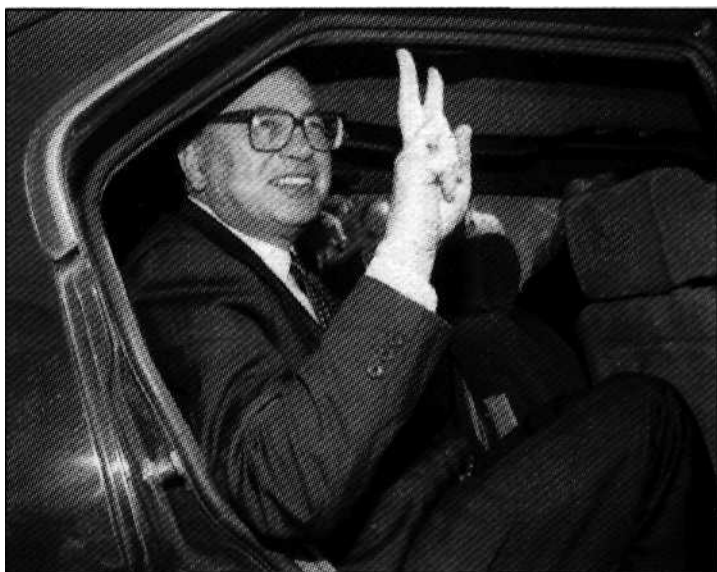
Das mächtige Triumvirat „CAF“, 1992 noch in Amt, Würden und Siegerpose: Craxi (oben), Andreotti und Forlani (unten).