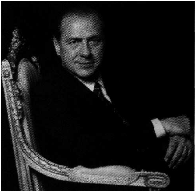
Zu Berlusconis Marketing-Methoden gehört die feudale Pose. Oben im „Spiegel“ (vor seiner Villa San Martina in Arcore), unten in „Newsweek“.