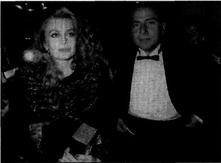
Selbstdarsteller Silvio Berlusconi, nach gewonnener Wahl im März 1994 mit Gattin Veronica.