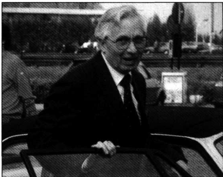
Der Pate: Lido Gelli, Maestro Venerabile der Geheimbunde P 2.