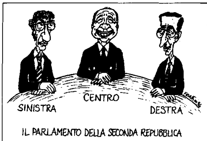
„Das Parlament der Zweiten Republik“: Die „Linke“ (Umberto Bossi von der Lega Nord), die „Mitte“ (Silvio Berlusconi), die „Rechte“ (Gianfranco Fini von der Alleanza Nazionale). Karikatur aus La Repubblica.