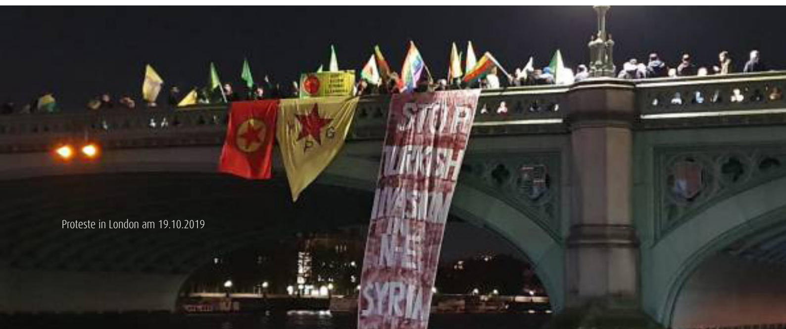
Proteste in London am 19.10.2019