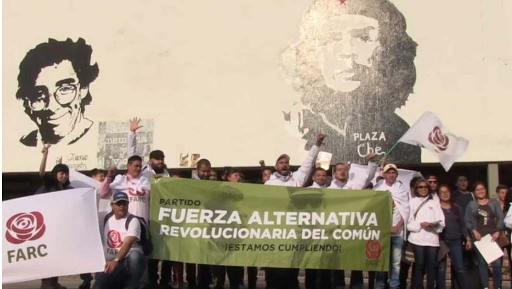
Wahlkampf der FARC 2018

und Ungeziefer gehaust. Im Gefängnis, das sie 2017 verlassen konnte, habe sie aber auch zum ersten Mal die Schule besucht und anschließend per Fernstudium Pädagogik und Psychologie studiert.