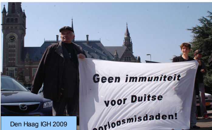
Den Haag IGH 2009

Voor het bezoek aan de zitting moet je je voor de 8e september aanmelden bij: http://www.icj-cij.org/docket/files/143/16590.pdf